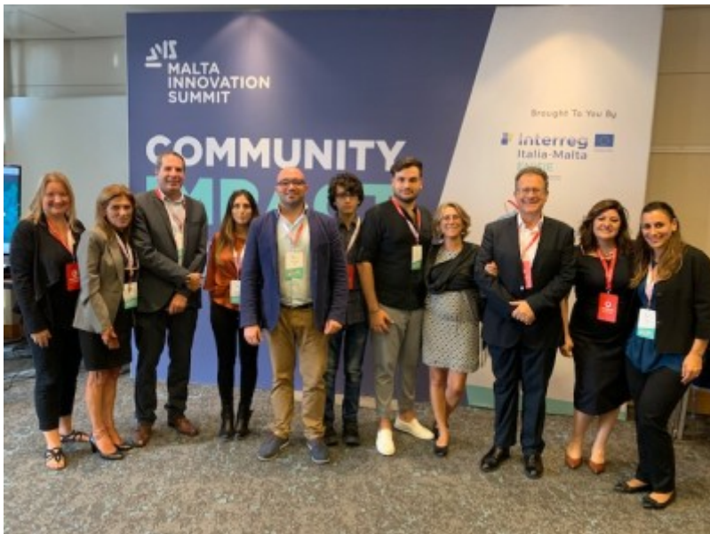
Delegazione di Enisie al Malta innovation Summit (ottobre 2019)

Promuove business e collaborazioni tra innovatori a vocazione sociale. Entrare nel network è gratuito e semplice: si crea un profilo, si creano i prodotti/servizi e si interagisce con gli utenti, siano essi imprese o singoli professionisti