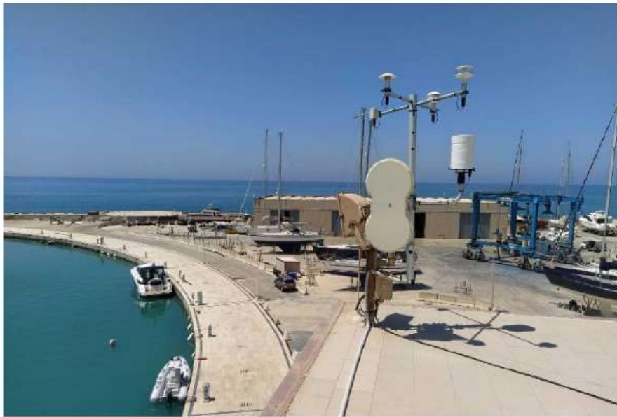
Installate stazioni meteo a Pozzallo e a Marina di Ragusa

Per il sistema di monitoraggio delle correnti marine nel canale siculo-maltese