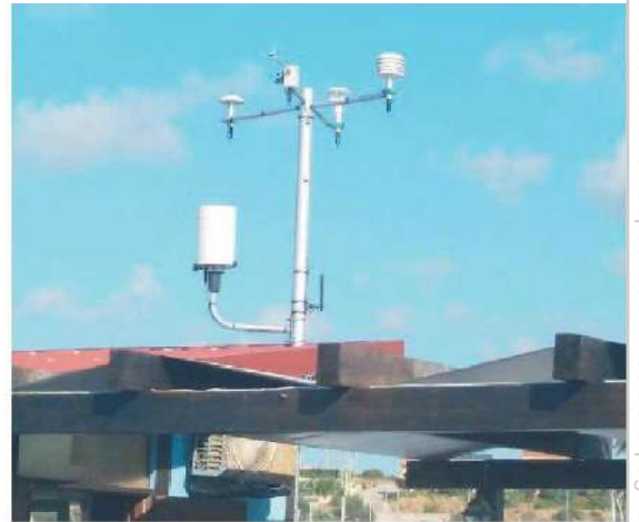
L'installazione a Pozzallo e, in alto, a Marina di Ragusa

al trasporto marittimo, abbiamo sviluppato una vera e propria rete di interscambio, in maniera congiunta, tra la Sicilia e Malta sempre più a servizio della risposta umanitaria nelle